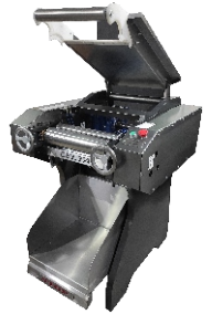
TABLA COMPARATIVA DE MODELOS